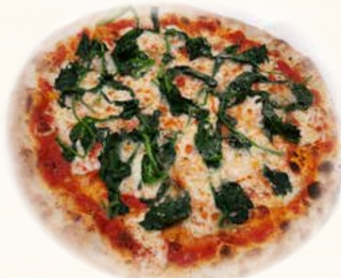
Braccio di Ferro